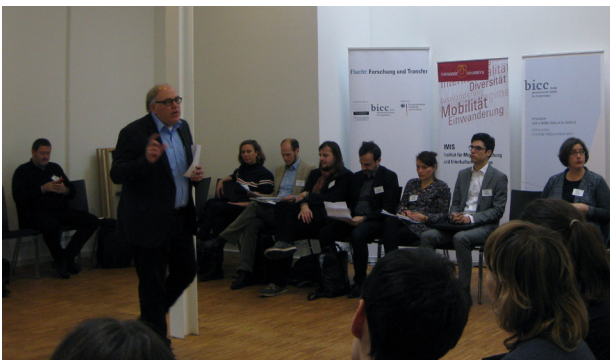
WissenschaftlerInnen und kommunale Akteure im Austausch über die Integration von Geflüchteten.

Der Erfahrungsaustausch über Motive, Kriterien und Herausforderungen des ehrenamtlichen Engagements mit Geflüchteten wurde vormittags in Kleingruppen geführt. Nachmittags stand eine Diskussion im World Café-Format über gemeinsame politische Handlungsempfehlungen im Vordergrund.